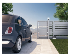
Automatyka do bram przesuwanych

Sieć sprzedaży: dystrybucja produktów Nice odbywa się poprzez sieć ponad 1500 dystrybutorów posiadających ponad dwa tysiące Licencjonowanych Instalatorów, którzy ukończyli profesjonalne szkolenie techniczne i pozytywnie zaliczyli wymagany egzamin. Listę rekomendowanych dystrybutorów można znaleźć na stronie www.nice.pl/gdzie-kupic .