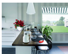
Automatyka do rolet