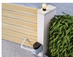
Automatyka do bram skrzydłowych