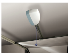
Automatyka do bram garażowych